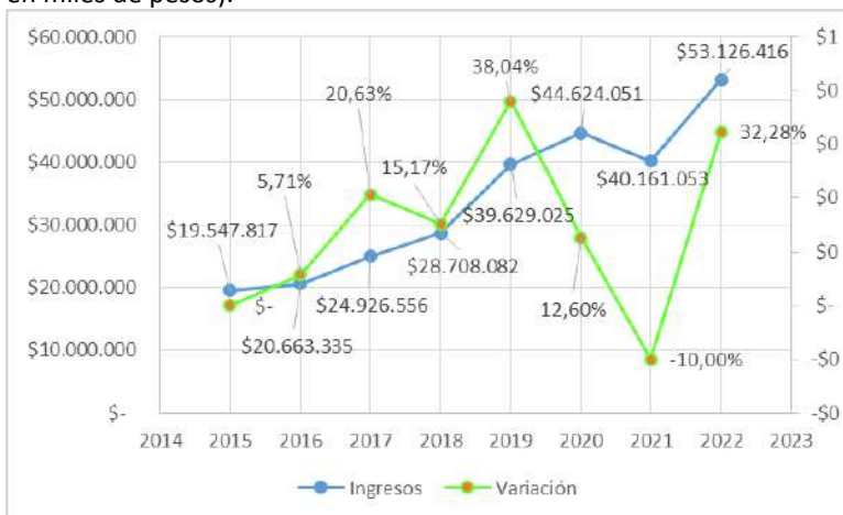
Gráfico 3: Variación anual ingresos sector turismo 2015-2022 (valores en miles de pesos).

Fuente: Registro mercantil – Cálculos Cámara de Comercio de Buga.