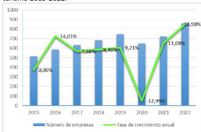
Gráfico 1: Variación porcentual anual empresas dedicadas al sector turismo 2015-2022.

Fuente: Registro mercantil – Cálculos Cámara de Comercio de Buga.