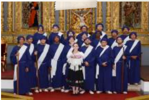
Participación en la procesión de Semana Santa con el paso del Santo Sepulcro