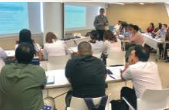
Comité Gestión Documental de las Cámaras del Suroccidente.