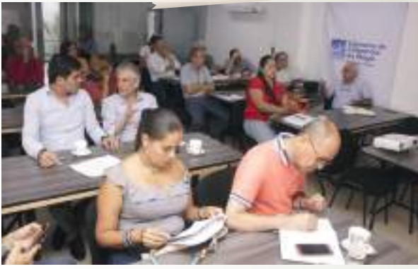
Minuta de constitución servidumbre para PTAR