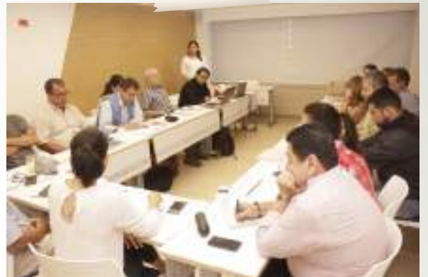
Nodos de Desarrollo Rural