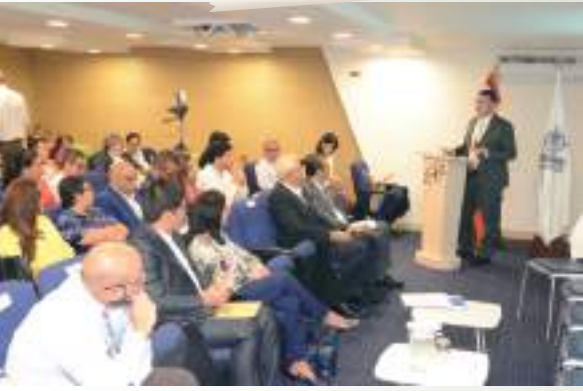
Socialización Guía de Actuación para la Conservación y Protección de los Centros Históricos, por la Procuraduría General, Alcaldía de Guadalajara de Buga y Cámara Comercio de Buga