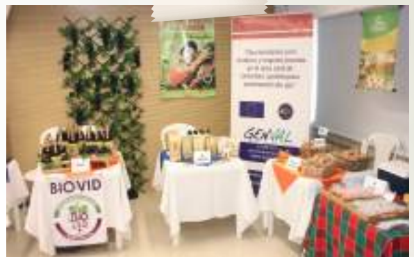
Muestra Empresarial Genval, ICCO y Cámara de Comercio de Buga