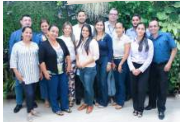
Renovación de la Certificación ISO 9001:2015 con el ICONTEC.