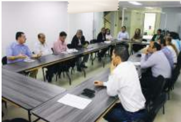
Comité Universidad - Empresa, actores Universidad del Valle, Fenalco, Cámaras de Comercio Tuluá y Buga y empresarios de la ciudad.