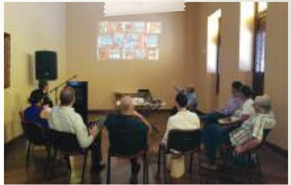
Junta Administradora Teatro Municipal de Buga