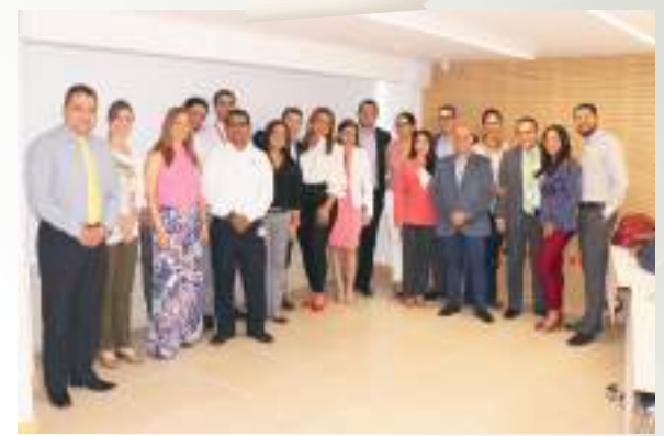
Comité de Bancos de Guadalajara de Buga