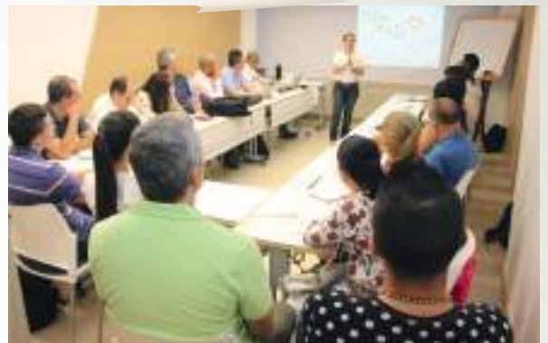
Socialización beneficios Nodo Cali Tecnoparque SENA