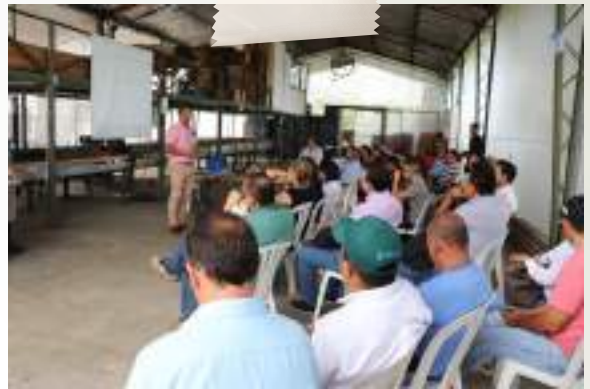
Presentación proyecto empresa agroindustrial Cablazquez con el acompañamiento de la Cámara de Comercio de Buga y recursos del SENA