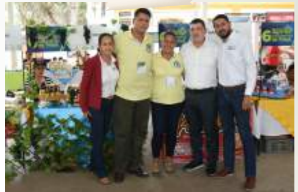
Cinco empresarios participando en la VI Feria Agroindustrial de Tuluá: Comeragro, Home Decor Colors, Ambrosias del Campo, Biovid y Canabidol