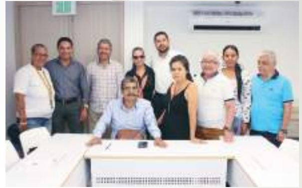
Consejo Territorial de Planeación municipal de Buga - CTP