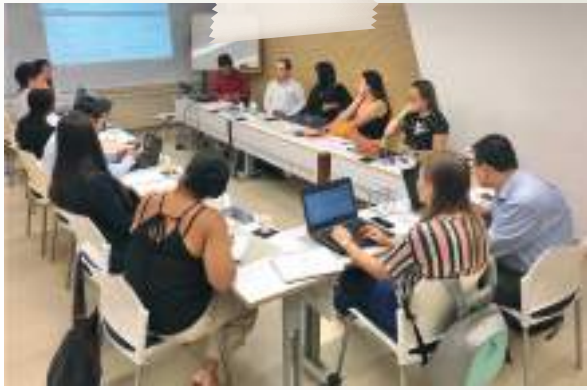
Comité jurídico y tecnológico de las Cámaras del Valle del Cauca