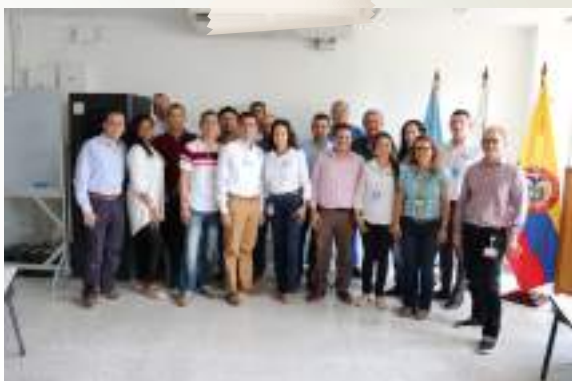
Visita experiencial con empresarios de la jurisdicción a TecnoParques Nodo Cali